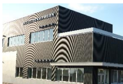
学校給食共同調理所