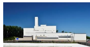
いわみざわ環境クリーンプラザ