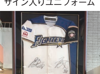
市役所本庁(鳩が丘1) 1階ロビー