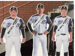
有明交流プラザ(有明町南1) 2階センターホール