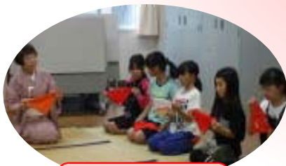
茶道教室(日の出小)