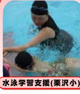
水泳学習支援(栗沢小)