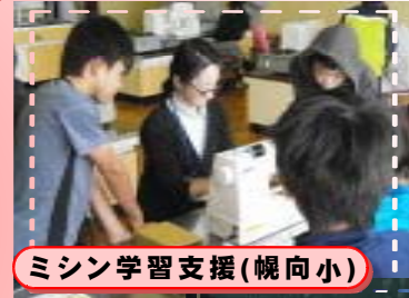
ミシン学習支援(幌向小)