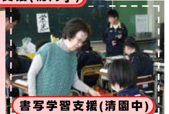
書写学習支援(清園中)