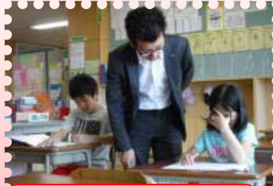
夏休み学習支援(メープル小)