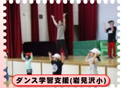
ダンス学習支援(岩見沢小)