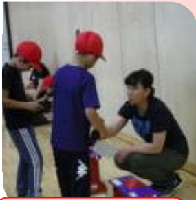
体力測定支援(志文小)