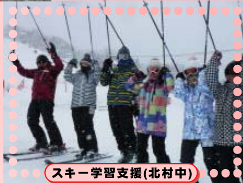
スキー学習支援(北村中)