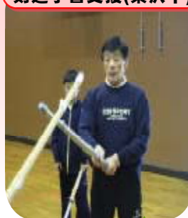
剣道学習支援(栗沢中)