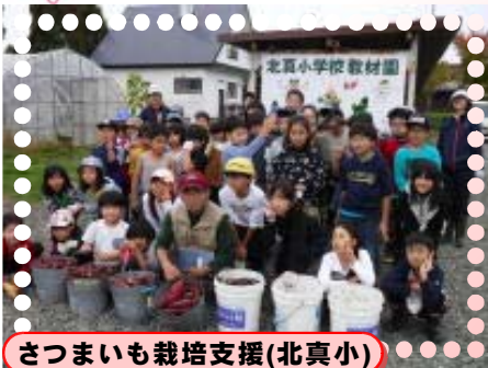
さつまいも栽培支援(北真小)