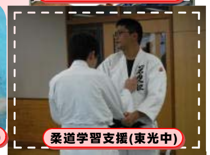
柔道学習支援(東光中)