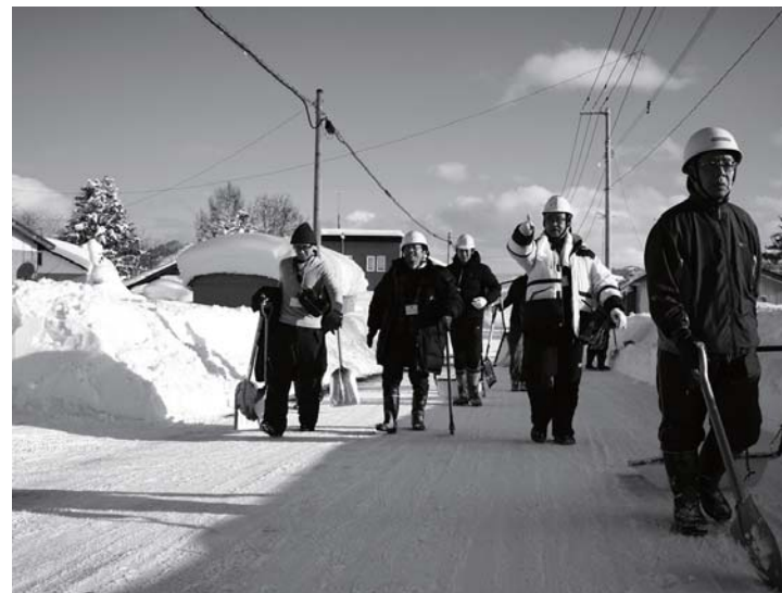
美流渡内を練り歩く雪かきレンジャーズ

最近さまざまな企業、団体の方々が雪かきボランティアに来てくださっているのを見聞きます。私がお手伝いしたのは、札幌発着のボランティアツアー。2日間とも40名ほどの方が来てくださいました。他地域では自治体などが受け入れをしているのに対し、美流渡の場合は、連合町内会が受け入れをしているため、地域の方との触れ合いも多く、それを楽しみに毎年参加してくれる方が多いそうです。主に、雪かきの困難な高齢者の方の住宅をまわり、雪かきをしていただきました。雪かきを通して地域に来て、地域ことを知ってもらえるのは嬉しいですね^^