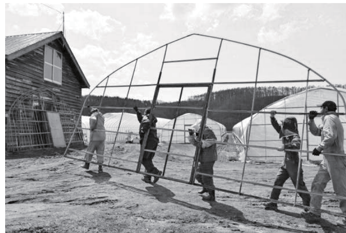
種まきの取材に訪れたつもりが、うっかりハウスのビニール張り作業員となりました。笑 取材協力：毛陽農産

シーズン中は天気に恵まれるといいですね。万字にお花見へ出かける際は、ポリタンク持参で お土産にポネ湯を汲んで帰られることをおすすめします♪