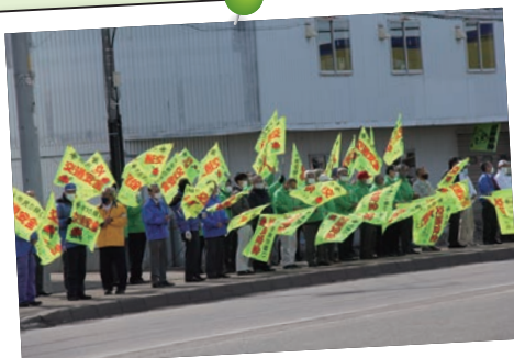
4月6日(火) 春の全国交通安全運動 セーフティコール旗の波