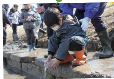
4月15日(木) サケの稚魚放流壮行会