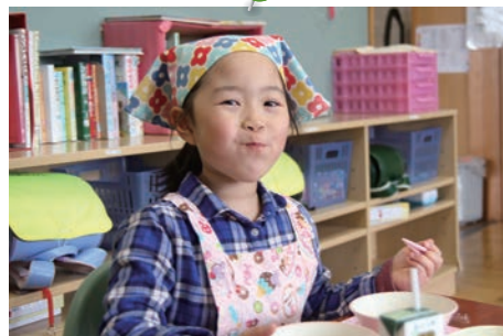
4月9日(金) はじめての給食(メープル小学校)