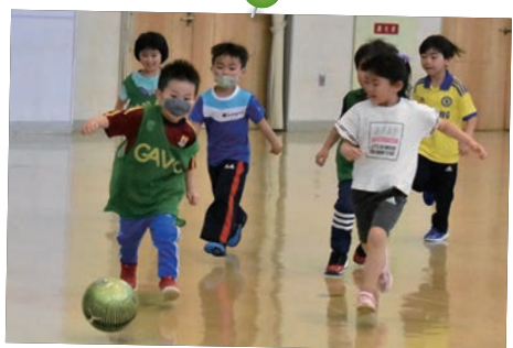
4月11日(日) サッカー・ボール遊び教室